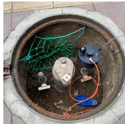
图4现场连接示意图

选择合适的信号接入点, 优先选择埋地放散阀, 次选调压箱/柜、立管的放散阀, 在周围设立警示区以避免非必要的安全事故。同时接入点尽量选择待测管道的上游。