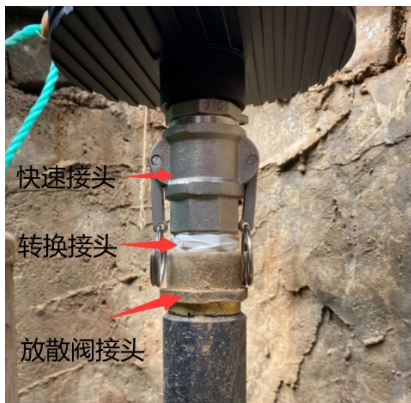
图5放散阀连接示意图

以放散阀为例,检查阀井内的情况排除安全隐患,然后检查放散阀接口的气密性确保放散阀门关闭。