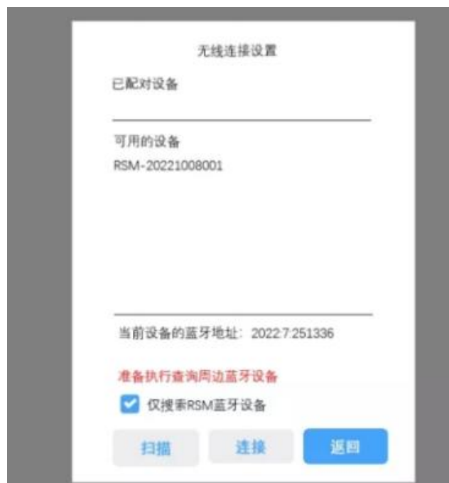
图 2 主机无线连接设置示意图

1.点击开关打开无线深度计数器。2.打开主机进入测桩模式，进入设置界面。3.在设置界面点击深度记录方式右侧，选择“无线自动记录”。4.点击“深度记录方式”，会弹出如下图所示的对话框。首先点击扫描，然后勾选对应深度计数器，然后点击连接。（此过程需要一定时间）连接成功后会弹出提示框，同时右上角出现蓝牙电量标识。5.点击返回。注意点击返回时还会有配对操作需等待一段时间。完成配对后即可实现二者开机自动连接，主机和无线深度计数器开机顺序无特定要求。6.点击“高级参数设置”将滑轮参数勾选为中滑轮，其中电缆直径以实际测量值为准。